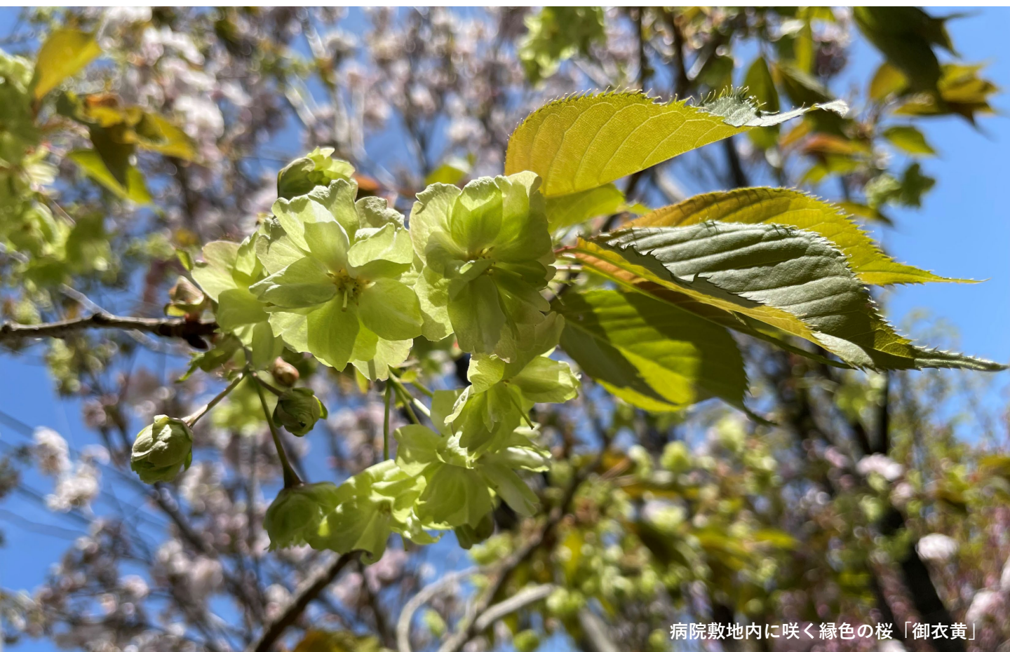
病院敷地内に咲く緑色の桜「御衣黄」